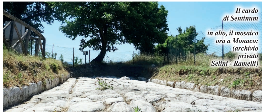
Il cardo di Sentinum in alto, il mosaico ora a Monaco; (archivio privato Selini - Ramelli)