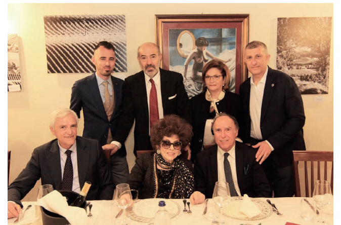
dere di più, ma non per questo mi sono mai arresa. E ce l'ho fatta». Una giornata che per molti resterà nel cuore.

perché nella vita i problemi e le difficoltà sono continui e non esistono scorciatoie o la possibilità che altri possano risolvere i problemi laddove non lo facciamo noi direttamente. Io l'ho imparato sulla mia pelle perché la mia passione era l'arte, il disegno, la pittura, la scultura, ma per molti ero solo una bella donna o al massimo un'attrice e non dovevo preten-