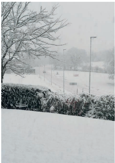
Abbondanti le neviccate nelle frazioni: qui, la salita che porta a Marischio

E' il bilancio della nevicata di lunedì 23 gennaio che ha rallentato la circolazione: garanzia regolarmente nelle vie principali, molto più problematica è stata nelle vie secondarie e nelle frazioni, soprattutto quelle più in quota dove i residenti hanno lamentato ritardi nella pulizia. Disagi anche per raggiungere la Cittadella degli Studi di Fabriano con alcuni genitori in difficoltà a raggiungere la sede con i mezzi. Ci sono stati rallentamenti anche sulla SS 76, tra Fabriano e Fossato di Vico: cinque i mezzi intraversati che hanno bloccato, a metà mattina, per mezz'ora, la