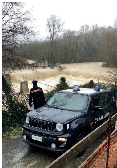
I Carabinieri impegnati nel monitoraggio dei fiumi