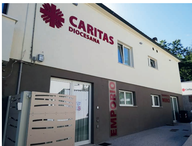
La Caritas Diocesana in via delle Fontanelle a Fabriano

A umentano le persone in difficoltà, per colpa della crisi economica e lavorativa. Sono anche italiani, con una percentuale di fabrianesi in aumento. Il quadro che dipinge la Caritas Diocesana di Fabriano Matelica, nel periodo che va dal primo gennaio 2022 al 30 novembre 2022, è allarmante. Solo al Centro di Ascolto della Diocesi sono arrivate 5.821 persone. Di queste ben 5.039 nella struttura fabrianese della Caritas, in via Fontanelle. Altre arrivano dalla parrocchia Misericordia e Cattedrale, dagli sportelli Caritas di Cerreto d'Esi, Matelica e Sassoferato. A queste 5.821 persone dobbiamo aggiungere più di 2mila seguite