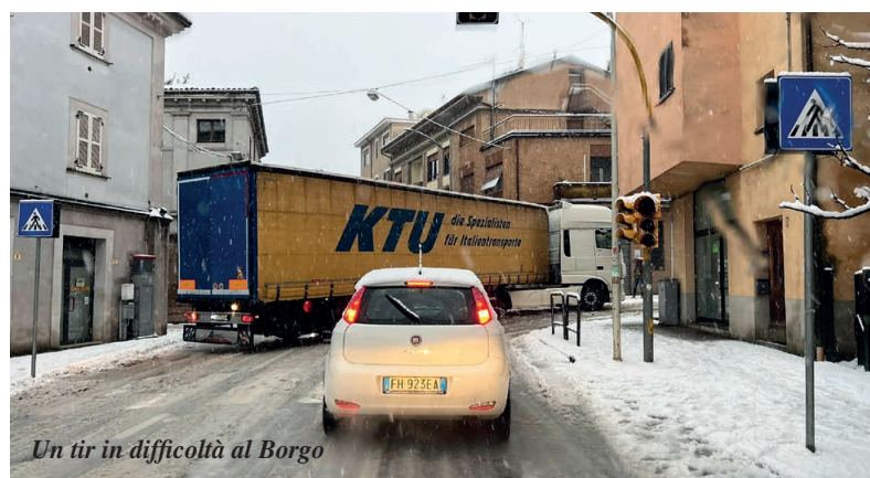
Un tir in difficoltà al Borgo