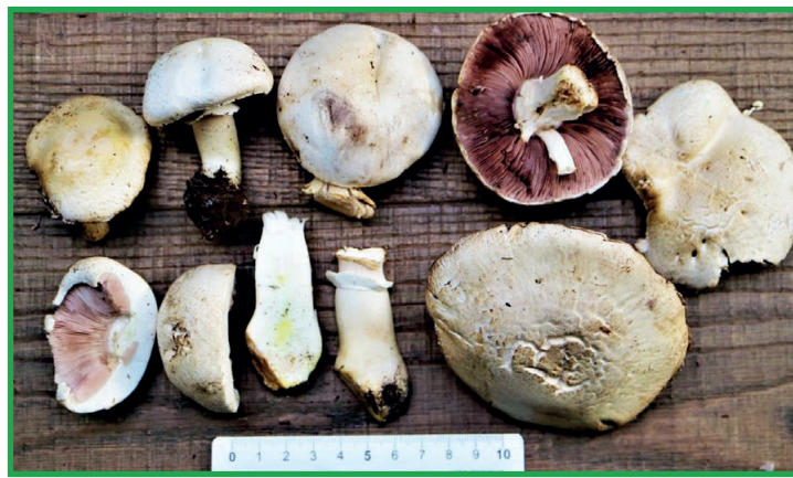
Iniziale fase di studio sulla prima raccolta