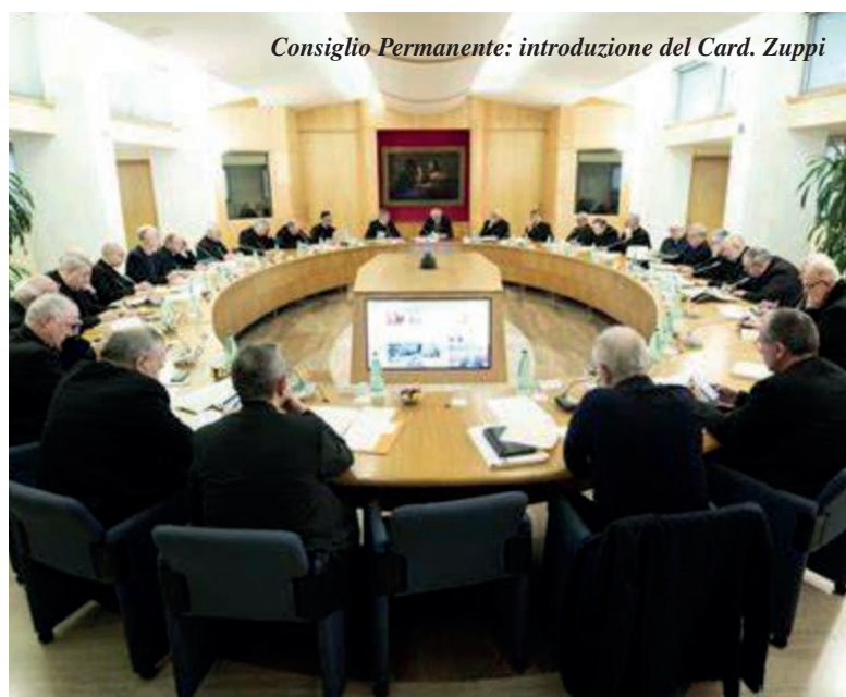
Consiglio Permanente: introduzione del Card. Zuppi

In vista della prossima assemblea della Cei, infine, in programma dal 22 al 25 maggio, il presidente ha auspicato “un ripensamento anche della struttura della Cei, più capace di esprimere la centralità della Parola di Dio e di servire meglio le Chiese che sono in Italia e rinforzare e servire la collegialità tra noi”.