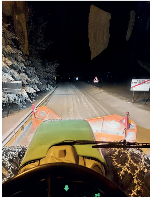
Spazzaneve in azione nella notte

In attesa dell'evolversi della situazione meteo la struttura rimane in allerta con tutti i mezzi e gli operatori che sin dalle prime ore di domani saranno operativi per garantire in sicurezza l'avvio delle attività" conclude il primo cittadino.